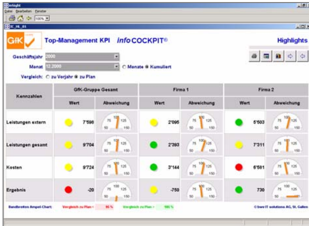
Kennzahlen-Dashboard für das Top-Management