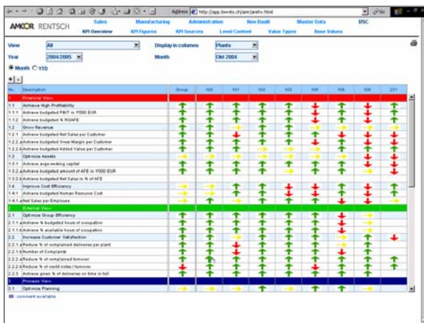
Balanced Scorecard im Controlling